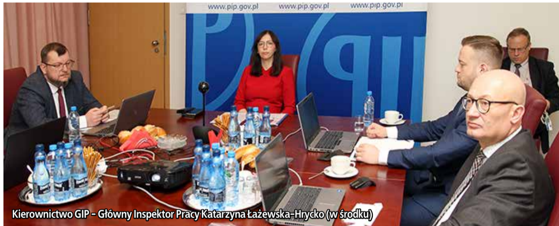
Kierownictwo GIP – Główny Inspektor Pracy Katarzyna Łażewska-Hrycko (w środku)

Zadaniami o kluczowym znaczeniu dla Państwowej Inspekcji Pracy na lata 2022-2024 będą trzy strategie, którymi objęte zostaną zakłady charakteryzujące się występowaniem dużej liczby wypadków związanych z pracą i wielu zagrożeń zawodowych: > Strategia kontroli i działań prewencyjnych dla sektora budowlanego. > Strategia kontroli zagrożeń chemicznymi czynnikami środowiska pracy. > Strategia wzmożonego nadzoru nad zakładami pracy.